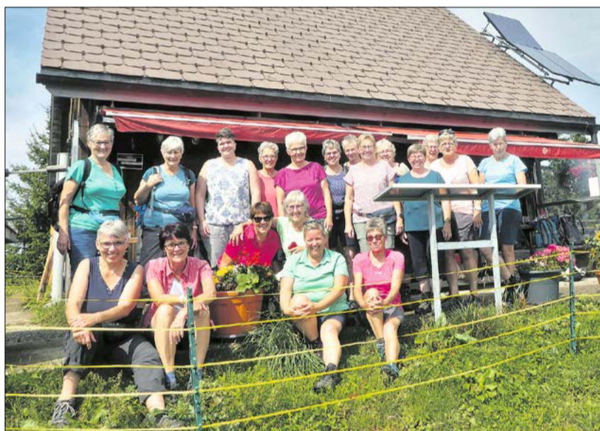
Die Turnerinnen genossen den Ausflug.

Die sportliche Gruppe wanderte zum Fläschlipass weiter Richtung Rosenhöchi zur Alp Wistannen. Die gemütliche Gruppe fuhr mit dem Kleinbus bis zur Alp und verbrachte die Zeit mit jassen. Alle zusammen genossen bei Anita ein feines Dessert, einen Kaffee und natürlich ein gesüffiges Honigschnäpsli im Stiefel serviert. Um 15 Uhr brachte der Chauffeur Marcel die gut gelaunten Frauen ins Hotel Allegro in Einsiedeln. Nach dem Check-In stand Baden im Sihlsee auf dem Programm. Irgendwie wurden alle mehr oder weniger nass. Später machte sich die Gruppe auf den Weg zum Nachessen ins Restaurant Romantica. Alle genossen Pizza, Teigwaren-Gerichte, Salate und dazu ein feines Glas Rotwein. Am Samstagvormittag wanderten die Frauen zur Sommersprungchancenanlage, wo die Airboard-Fahrer beim Herunterfahren beob-