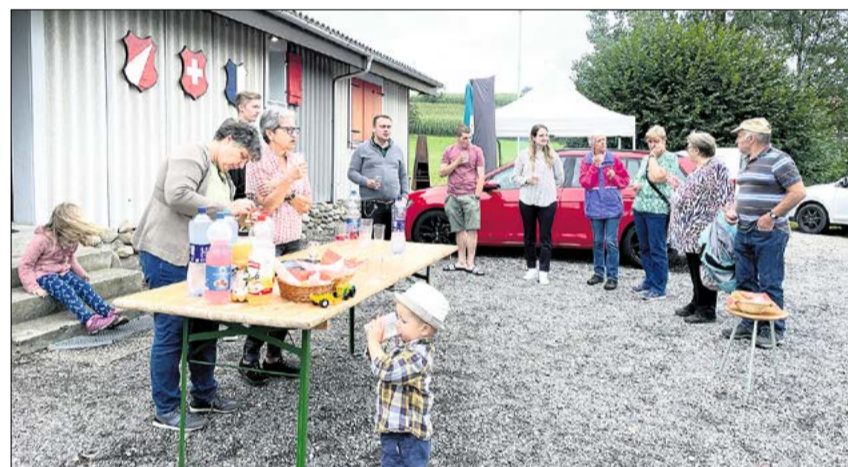
Klein und Gross trafen sich zum Jubiläums-Grillplausch.