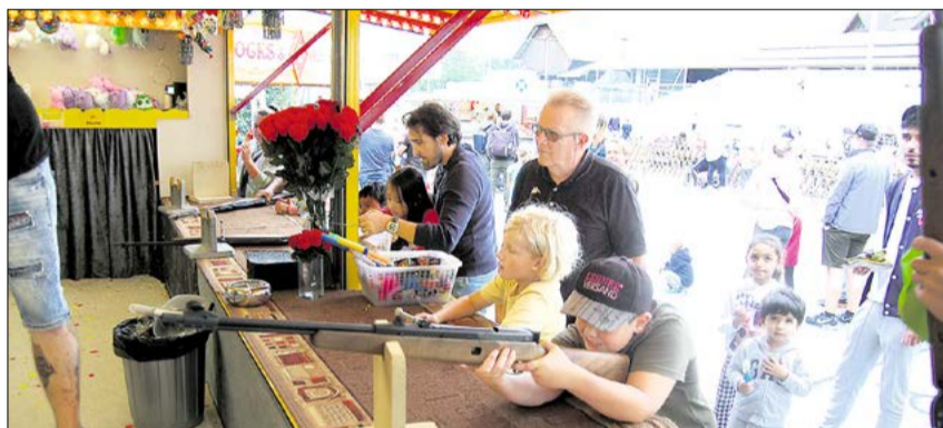
Am Schiessstand war Treffsicherheit gefragt.

laufe des Nachmittags zünftig nass werden. Die organisierende Ortsmusik Rüediswil liess sich aber nicht überraschen und passte den Kilbibetrieb der gegebenen Situation an. Das Lebkuchendreihen wurde kurzerhand ins Festzelt verlegt, und in kurzer Zeit waren die schönen Preise an die glücklichen Gewinnerinnen und Gewinner verteilt. Das Karussell drehte zur Freude der Kinder seine Runden, beim Schiessstand versuchten kleine und grosse Schützen in die Mitte zu treffen und beim verdeckten Fischen angelten sich Kinder schöne Preise.