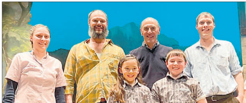
Diese 3 Generationen sorgen auch zukünftig für bodenständiges Brauchtum auf dem Steinhuserberg.

Mit dem Motto «Pistenfieber» unter der Rennleitung von Renate Michel, verbunden mit einer sorgfältigen Liedgestaltung, erfreute der Jodlerklub das zahlreich erschienene Publikum einmal mehr. Unter der Leitung von Beat Röösli wird die Theatergruppe mit dem Theater «De Häfelibrönnen vo Bätziwil» vielen Theaterfreunden wiederum in bester und froher Erinnerung bleiben. Traditionsgemäss sind die Theater auf dem Steinhuserberg aus dem Leben gegriffen. So boten Theaterspielerinnen und -spieler mit viel Humor, Bodenständigkeit und Glaubwürdigkeit unbeschwerter und