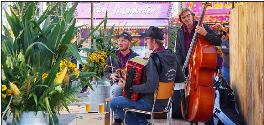
Einige Impressionen von der diesjährigen Kilbi in Rüediswil.