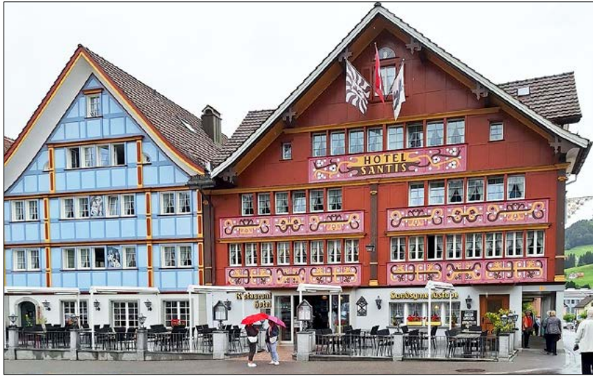
Die schönen Bauten beim Landsgemeindeplatz.

Und wie bestellt, verzogen sich just in diesem Moment die Regenwolken. So bot sich nach dem Essen die Gelegenheit zu einem gemütlichen Spaziergang durch das schmucke Städtchen Appenzell, mit seinen farbenfrohen Häusern und die einladenden Gassen. Viele genossen es, endlich die Schirme zu schliessen