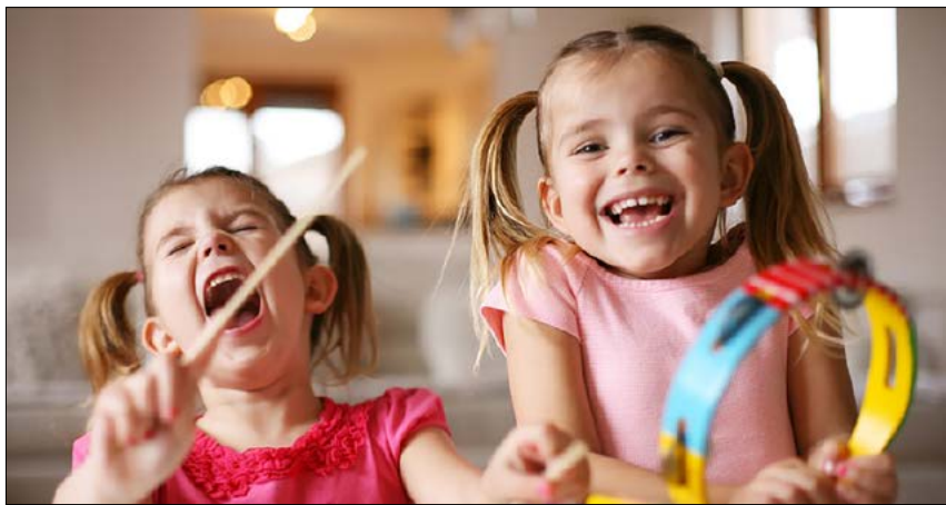
Musizieren macht Spass.